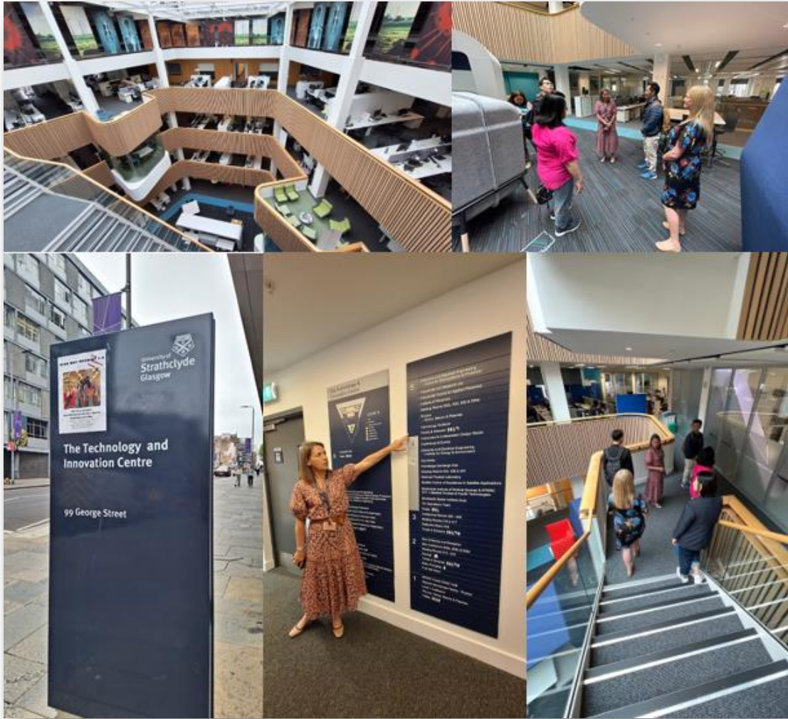
รูปที่ 4 บรรยากาศการเยี่ยมชม Technology and Innovation Center