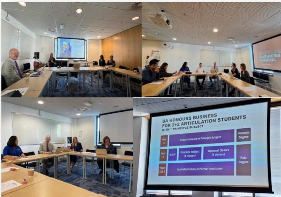
รูปที่ 2 บรรยากาศการเจรจาหรือความร่วมมือระหว่างวิทยาลัยนานาชาตินวัตกรรมดิจิทัล และ Strathclyde Business School

โครงการหนึ่งคณะ หนึ่งโครงการต่อยอดความร่วมมือขับเคลื่อนมหาวิทยาลัยสู่โลก