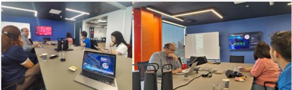
รูปที่ 7 บรรยายภาพการหารือความร่วมมือทางวิชาการระหว่างมหาวิทยาลัยเชียงใหม่และ Staffordshire University